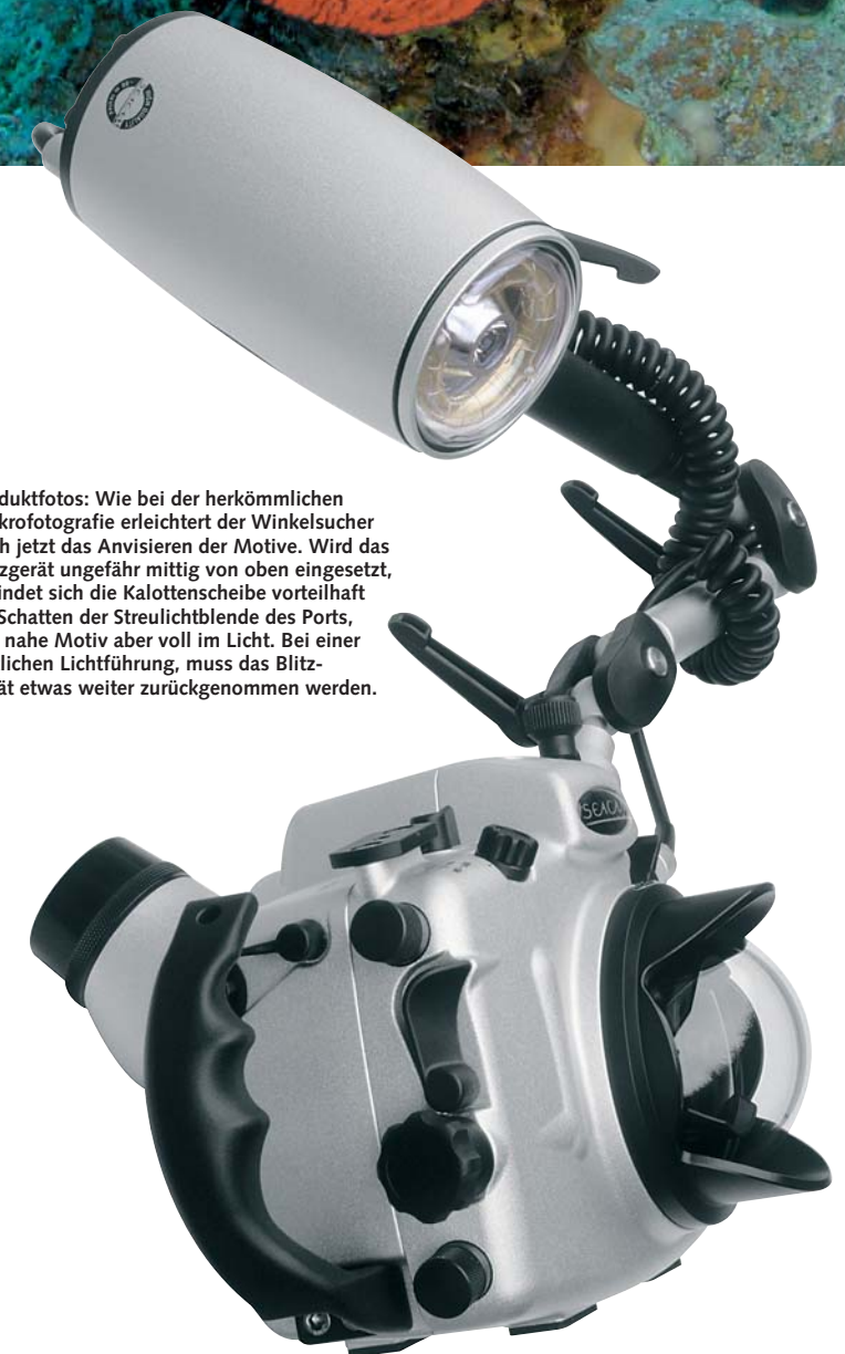
Produktfotos: Wie bei der herkömmlichen Makrofotografie erleichtert der Winkelsucher auch jetzt das Anvisieren der Motive. Wird das Blitzgerät ungefähr mittig von oben eingesetzt, befindet sich die Kalottenscheibe vorteilhaft im Schatten der Streulichtblende des Ports, das nahe Motiv aber voll im Licht. Bei einer seitlichen Lichtführung, muss das Blitzgerät etwas weiter zurückgenommen werden.

Text: Werner Fiedler, Fotos: Seacam (1), Werner Fiedler