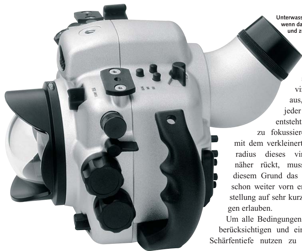
Unterwasserfotos: Aufnahmen dieser Art wirken am eindrucksvollsten, wenn das nahe Hauptmotiv die Landschaft dahinter nicht zu sehr verdeckt und zusätzlich ein Farbkontrast besteht

wiederum wirkt sich auf das virtuelle Bild aus, das hinter jeder Domscheibe entsteht und auf das zu fokussieren ist. Weil mit dem verkleinerten Kalottenradius dieses virtuelle Bild näher rückt, muss auch aus diesem Grund das Objektiv die schon weiter vorn erwähnte Einstellung auf sehr kurze Entfernungen erlauben.