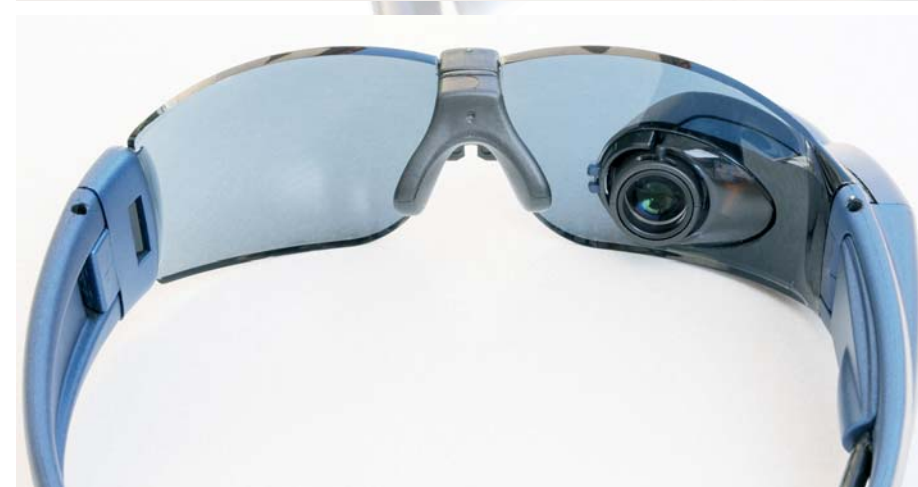
Links: Die Videobrille mit dem Okular für das rechte Auge. Rechts: Die Steuereinheit zur Videobrille