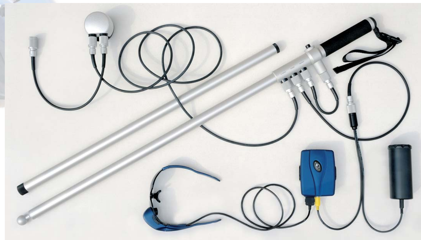
Diagonal im Bild ist die kurze Version der Führungsstange zu sehen, die gewöhnlich noch um das daneben liegende Rohr verlängert wird. Links oben befindet sich der S6-Stecker für die Remote-Buchse. Ihr Kabel führt zum E-Sucher, der wiederum mit dem Handstück der Führungsstange verbunden ist. Über ein kurzes Kabel ist der Auslöser angeschlossen. Die dritte (mittlere) Buchse dient der Verbindung mit der Steuereinheit (blau) der Videobrille, deren Stromversorgung (schwarzer Akkutank) rechts unten zu erkennen ist

Das Sandstativ mit seiner Rammspitze aus rostfreiem Stahl wird wie ein Pfahl in den Sedimentboden gedrückt. Um hingegen agile Objekte vom Boot, vom Ufer oder vom Schwimmbeckenrand aus mit der Kamera verfolgen zu können, benutzt der Fotograf eine Führungsstange (Pole) aus seewasserbeständigem Leichtmetall. Auch sie gibt es in voneinander abweichenden Ausführungen, die sich für die Kombination mit verschiedenen Komponenten eignen. Die Länge der Stange, die wegen des komfortableren Transports dreiteilig und wasserdicht verschraubbar ist, begrenzt hier die Einsatztiefe. Das Kameragehäuse wird mit der Führungsstange über ein Kugelgelenk verbunden, so dass vorab die Ausrichtung für Quer- oder Hochformataufnahmen gelingt.